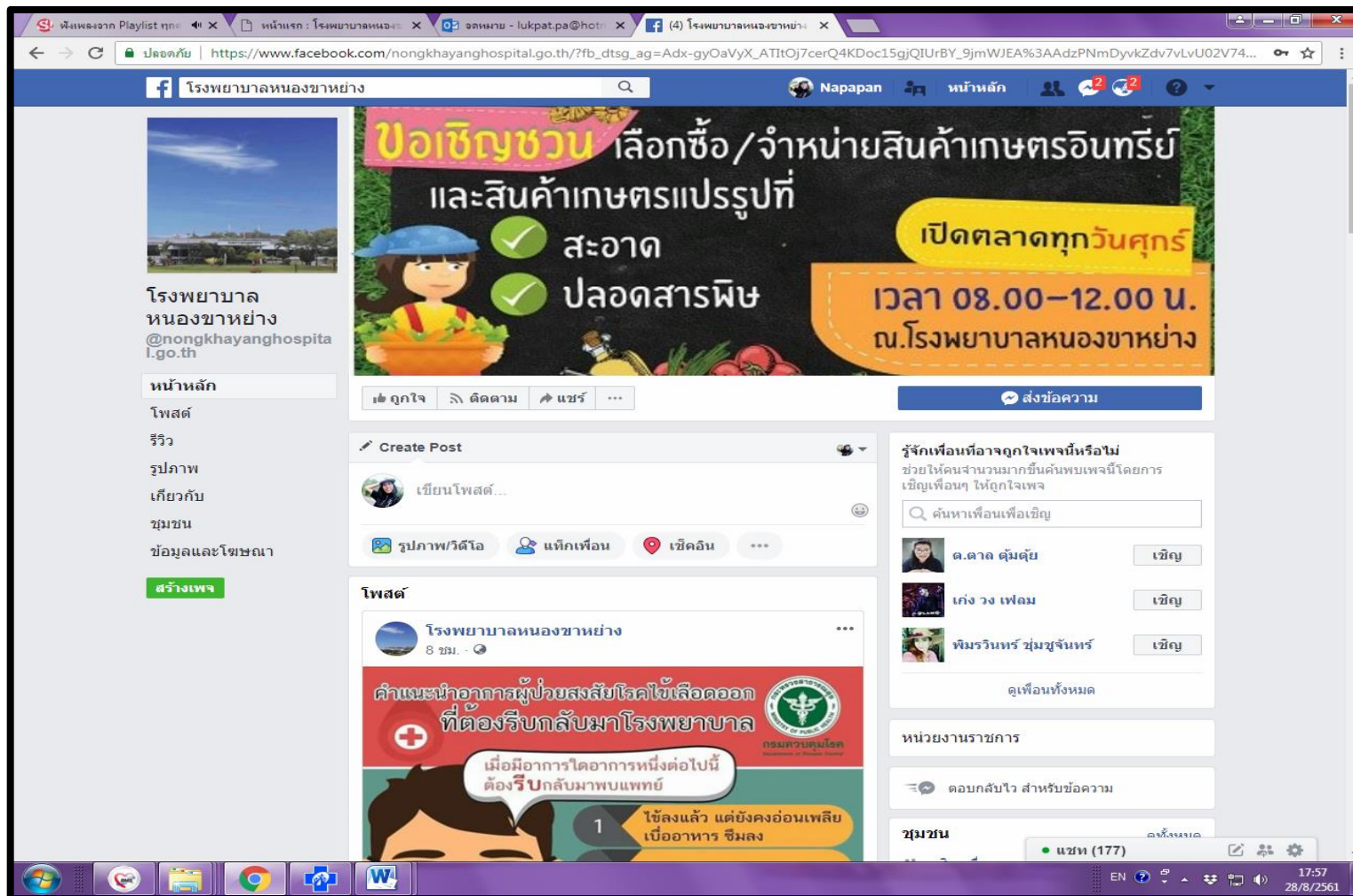
ช่องทางสำหรับผู้ร้องเรียนผ่าน facebook โรงพยาบาลหนองขาหย่าง